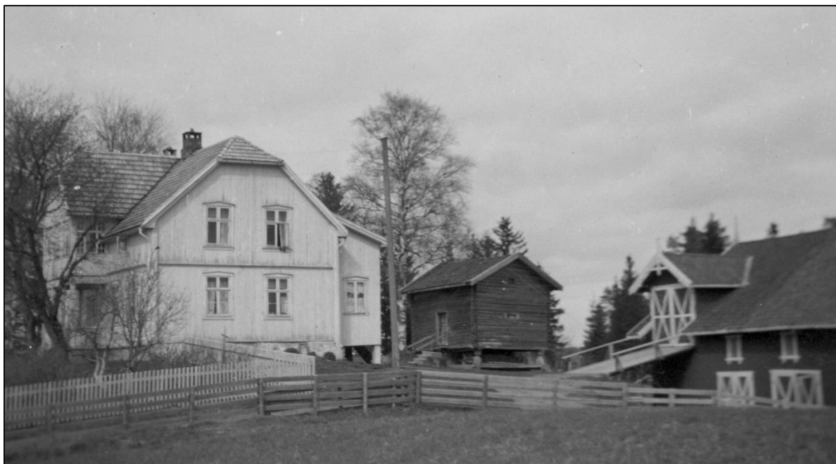
Melvold østre på Frogner i Sørum – det meste er forandret siden dette bildet ble tatt i 1932.