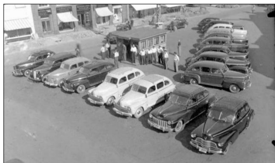
Drosjetorvet (Høytorvet) tidlig på 1950-tallet.