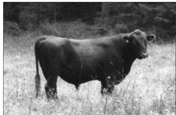
Simson-kollega 2011 - østlandsk rødkolle.

Men var det Simson? Godt mulig. Antakelig ikke.