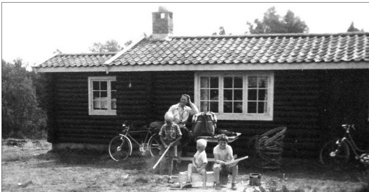
Eneste bilde fra ferien på Solseter. Nesten 60 år senere står hytta der stadig, nesten som den gang.