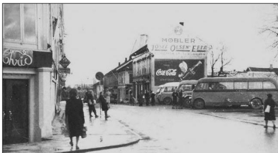
Øybuss i Storgaten, der biblioteket ligger i dag.

Vi kunne selvfølgelig gått opp i Storgaten, der Øybuss hadde rutebilstasjon og kjørte sommeruter fra 20. juni. Men det ble vel for