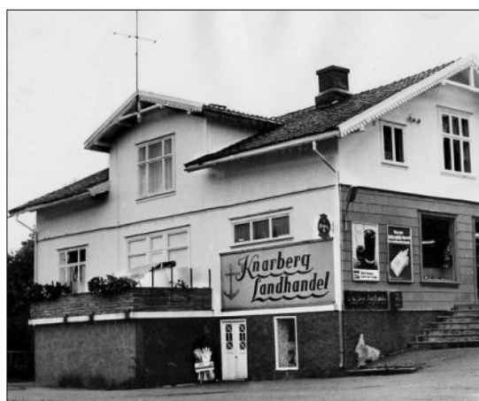
Hånd i lanke til Knarberg Landhandel.

Vi var i begivenhetenes sentrum, mens vi ferierte. Den store spritsmuglersaken i Knarberg og en ny runde med Rottenikken verserte for retten. På Tønsberg stadion