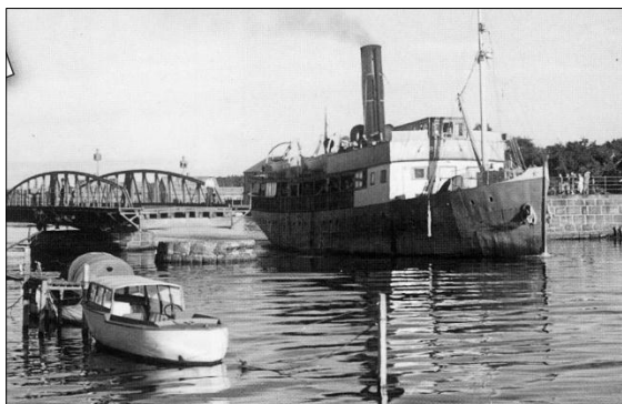
D/S "Jarlsberg" gjennom Kanalen i Tønsberg.

Oslofjordens raskeste båtforbindelse Vi kom med dampskipet "Jarlsberg" - Oslofjordens raskeste båtforbindelse.