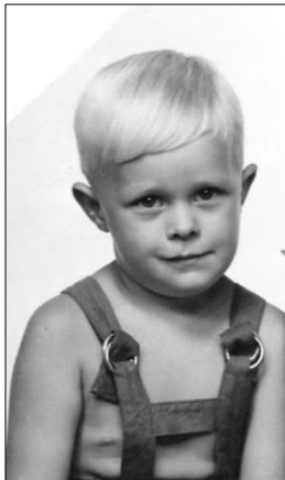
Sterke saker for en liten gutt fra den store byen.

Hvorom allting er; en ettermiddag rigget vi oss til på låvebrua hos Viken. Der skulle vi komme til å bivåne en seanse som ga læring for livet, jeg husker det enda. Uten å gå i detalj; oksen gjorde jobben sin!