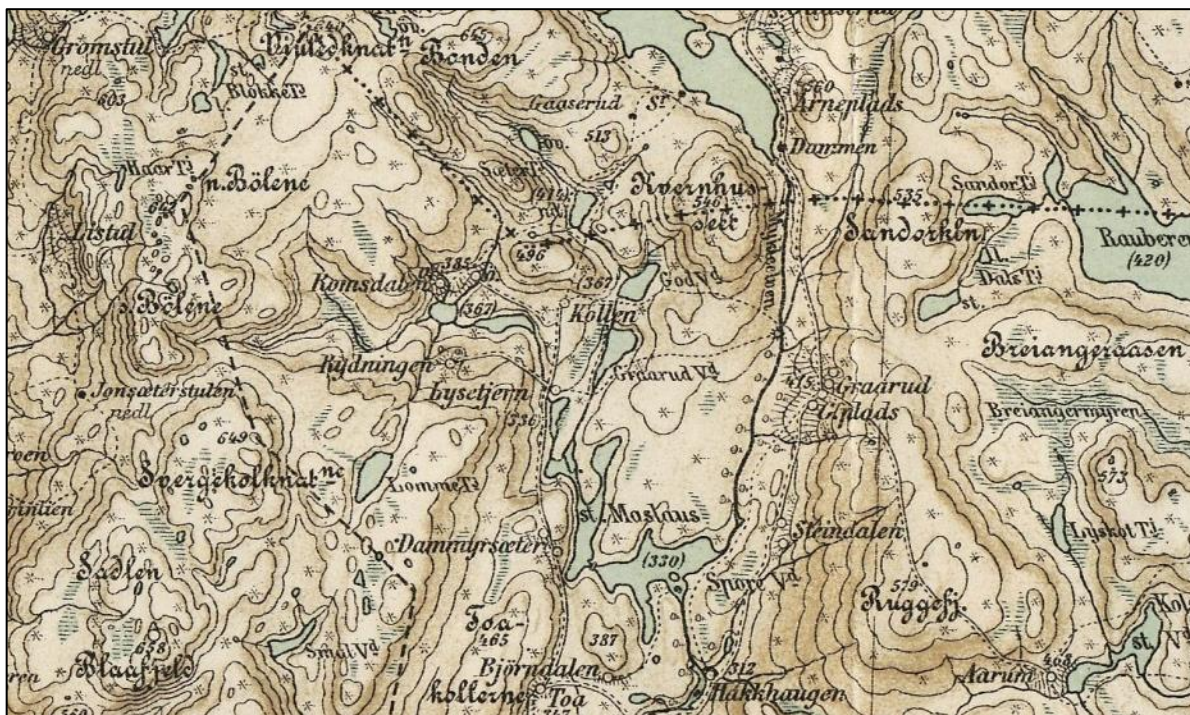
Et gammelt kart etter far min, oppmålt 1890, bekrefter at han selv trådte gamle stier og nok visste mer enn han fortalte.