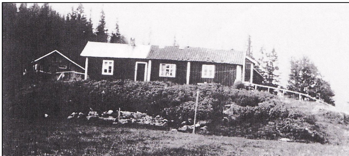
Den gamle Hajernstua med fjøs.