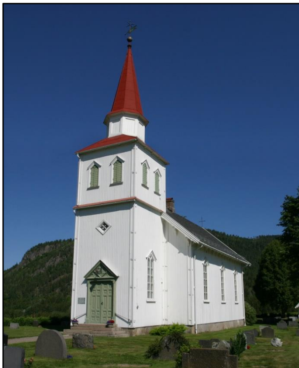
Komnes kirke